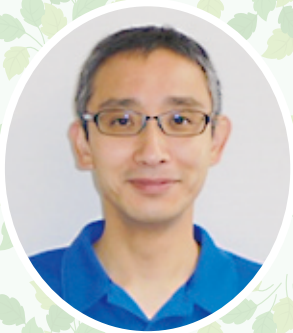
コムニの里みどりヶ丘