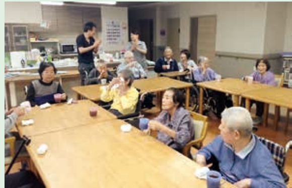
写真は誕生会のご様子です。

ショートステイは要支援1・2、要介護1から5の認定を受けている方が対象となっております。帯広市外の方でもご利用はできますので、こちらも随時ご相談を受け付けておりますのでお気軽にご連絡下さい。