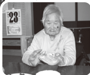
これぐらいでいいかな?