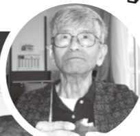
やっぱりおはぎは美味しいね!

4月は皆さんのリクエストでおはぎ作りに挑戦しました。皆さん、慣れた手つきで、「昔はよく作ったね」等と話しながら懐かしみながらおはぎづくりを楽しんでいました。その後は、皆さんで試食をし、昔話をしながらひと時を過ごしていましたよ。(小規模特養)