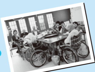
お食事レクリエーションのひとつ