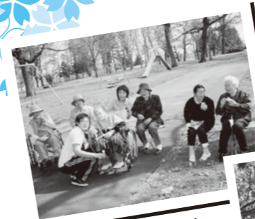
小規模の利用者様と一緒に写真撮影