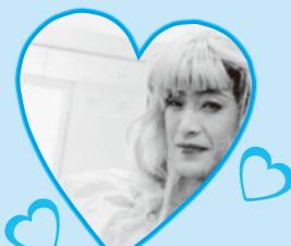
ムンムンなお色気♡

これからも利用者様が住み慣れた地域で元気に楽しく過ごして頂くことができるように、また、介護しているご家族が安心して過ごせるように努力して参りますので、ご支援の程、よろしくお願いいたします。(小規模特養)