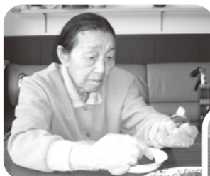
慣れた手つきですね