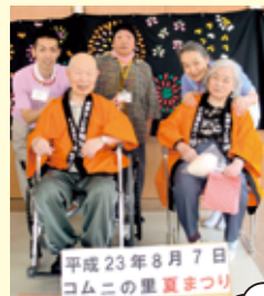
平成23年8月7日 コムニの里 夏祭り