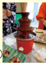
チョコフォンテコーナー