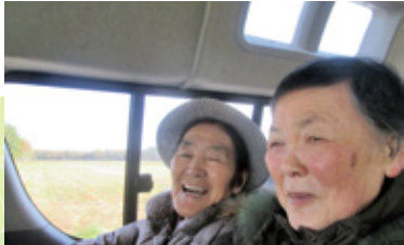
みどりヶ丘小規模

「紅葉ドライブ」ピョータンの滝へ。外出機会が少ない入居者様のために花畑牧場を経由してのドライブを楽しみました。「ほら、こんなにきれいだよ」真っ赤に色づいたもみじの葉を拾って見せてくれました。