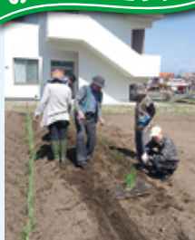
みどりヶ丘サ高住