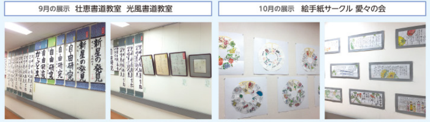
●11月のギャラリーは絵手紙展です。