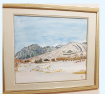
●1月のギャラリーは写真展と絵手紙展です。