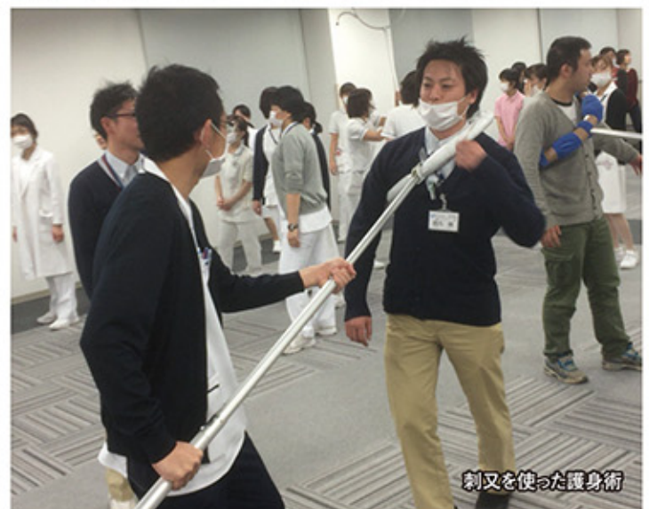
刺叉を使った護身術