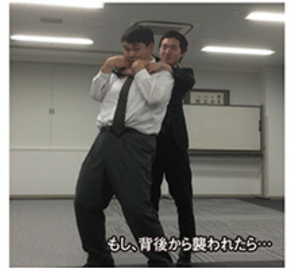
もし、背後から襲われたら...

博愛会では初めての試みでしたが、当日は看護師や介護職員のほか、事務職員、薬剤師など56名の職員が参加し、刺叉を使った撃退術をはじめ、「万が一自分の身に危険がせまったら」を想定した講習に参加者は真剣に取り組んでいました。