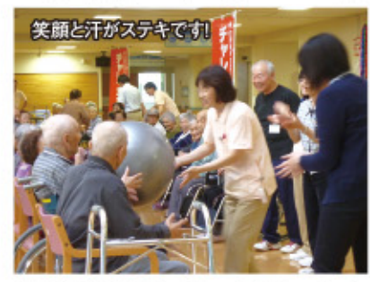
▲笑顔と汗がステキです!

しかし、敗れたとはいえ、利用者様と職員が一丸となって挑んだ思い出は、この日流した汗とともに、キラリと輝き続けることでしょう。