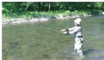
▲大自然に囲まれて