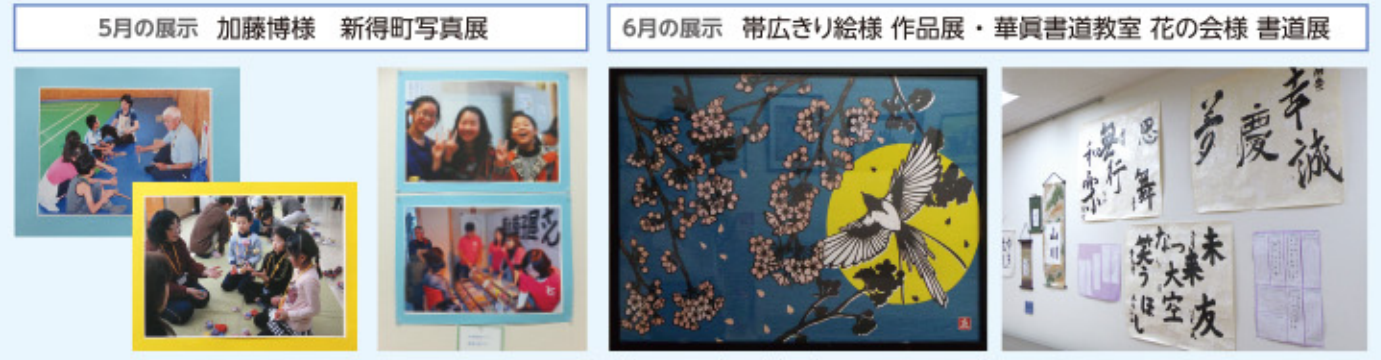
●7月は押し花展です。ぜひ、ご覧ください。