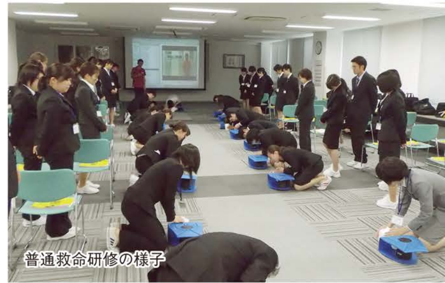
普通救命研修の様子

この4月、医療法人社団博愛会は46名の新たな仲間を迎えました。4月3日、緊張した面持ちで初日を迎えた新入職員たちは、まず二日間の全体オリエンテーションを受講します。オリエンテーションは、博愛会各事業所・部署の紹介、接遇研修、防火防災研修、交通安全講習、普通救命研修、医療安全研修、感染防止対策研修、事業所見学など、非常に盛りだくさん!充実した二日間となりました。そして5日からは各所属先での研修を受け、いざ、現場へ!14日には新入職員歓迎会を開催いたしました。頼もしい仲間が増えた博愛会、今後とも宜しくお願いいたします。