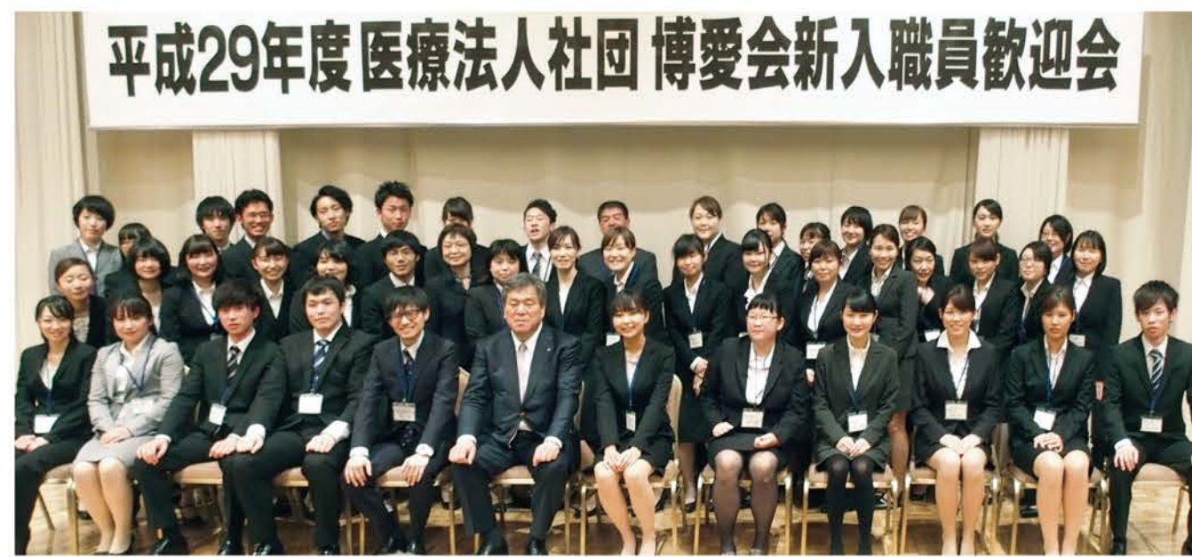
平成29年度医療法人社団博愛会新入職員歓迎会