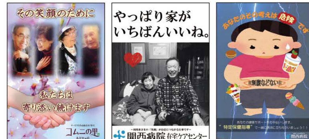
サービス付き高齢者向け住宅 開西病院 在宅ケアセンター 開西病院 在宅ケアセンター 開西病院 健診センター

「ポスターコンテスト」は、各部署が自らの「強み」をPRするポスターを制作する企画で、昨年4月に初開催しました。各部署内でスタッフが協力してポスターを作製することで、部署内で「強み」の認識が統一され、他部署とも情報共有することができ、それによって職員一人ひとりが、「博愛会の強み」をしっかりと意識でき、サービス向上にも繋がる、という効果が期待されます。「博愛会学会」の会場で実施された今回は、社会福祉法人博愛会と合同開催とし、計18作品が集まりました。ポスターは、スタイリッシュなものもあればコミカルなものもあり、中には、パソコンを使わず紙を切り貼りして作った力作もあるなど、非常に個性豊かで、見る人を楽しませました。