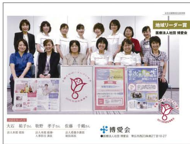
女性の活躍は博愛会の大きな特徴のひとつです (フォーラム公式パンフレットより)

働く女性の交流組織「十勝キャリアデザインネットワーク」主催の「第4回キャリアデザイン大賞&フォーラム2017」が帯広市内で開かれ、博愛会が「地域リーダー賞」を受賞しました。女性活躍企業の躍進著しい十勝において、「女性が活躍できる職場作り」のモデルとなる企業を表彰・紹介する場として「地域リーダー賞」「チャレンジ企業賞」が創設されました。博愛会は、院内保育所・復職支援セミナー・男性職員の協力と理解などを充実させ、結婚・出産・育児による女性の離職率が下がった実績や、女性管理職者の活躍などで高い評価をいただいていたの受賞となりました。当会では、「スタッフ定着と魅力ある職場環境づくりは、患者様や利用者様に対するサービスの質向上に直結する」という考えのもと、助け合う気持ちを育み、未婚・既婚、性別・年齢に関わらず働きやすい組織風土を、今後一層目指して地域住民の皆さまの健康に貢献してまいります。