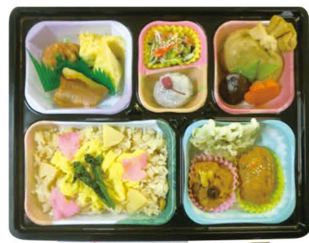
栄養科からのおもてなし「春香る 桜弁当」