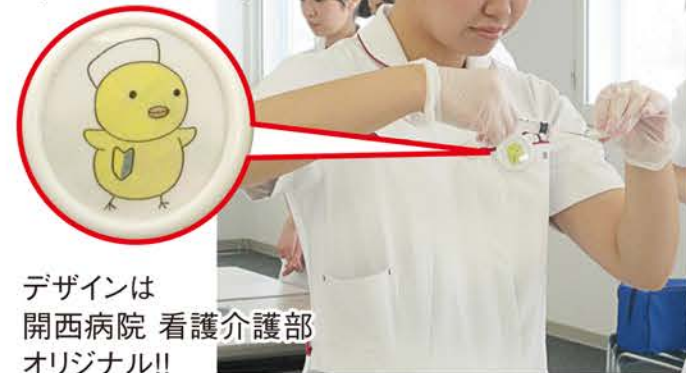
デザインは開西病院 看護部オリジナル!!