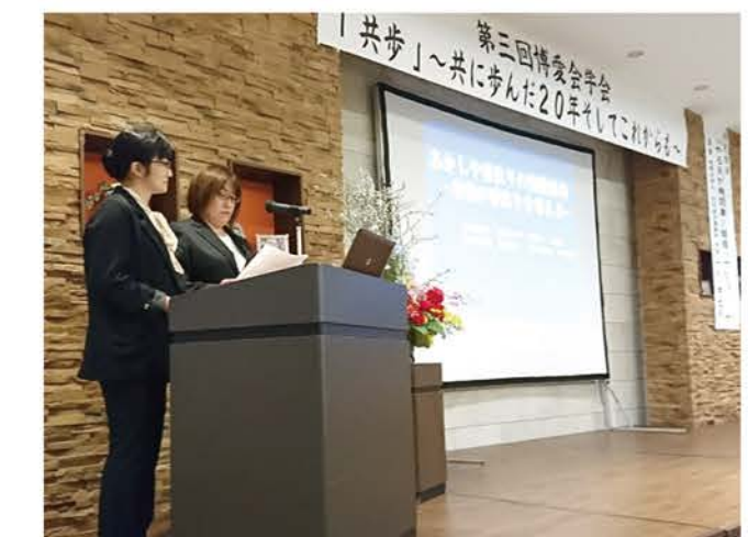
▲発表にも熱が入ります