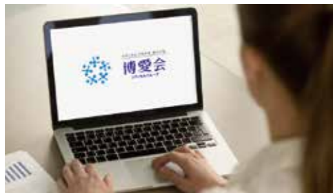
各事業所のネット上での発信などにロゴとスローガンを付けSEO対策!