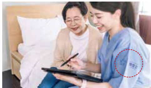
グループ各社・各施設のユニフォームに新ロゴが入る可能性も