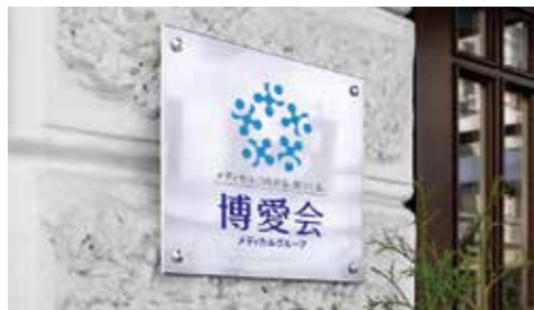
各事業所の入口などに看板としてグループロゴとスローガンを設置!?