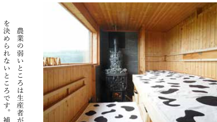
ロッジにミルクサウナ。BBQや外気浴で牧草地に出ても、健康な土から生えた草を食べる牛たちは、糞尿の臭いが驚くほど少ない。

康にならない。牛を健康にするには土から健康にする必要があります。土壌改良を進めるべく、ニュージーランドの農業コンサルタントに依頼して農場の土を徹底的に分析してもらいました。土壌に足りないものを科学的に見極めたうえで肥料を投入し、土のミネラルバランスを整えていく。変化が表れたのは3年後。土壌の生態系が豊かになったことで、糞の分解速度が高まりました。牛たちは草を食べるようになり、病気になることも減ったのです。健全な食べものから健康になる。そういったところは人間と同じですね。