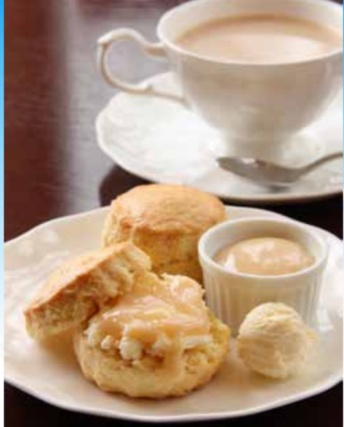
スコーンとクロテッドクリーム、イングリッシュミルクティーのセット。十勝しんむら牧場の牛乳の味わいを楽しめる組み合わせ。

牧場を継ぐと決めたのは大学時代。当時の私は、正直なところ農業に興味がありませんでした。そんな中、ちょうどバブルが弾けた。社会が激変する中で、仕事とは何なのか、自分の人生は何なのかを考えました。思考を掘りさげてたどり着いたのは、