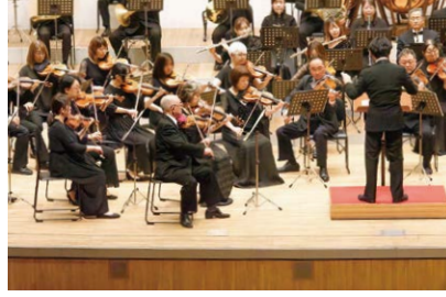
2025年5月に開催された第45回定期演奏会。2026年の開催は、2026年5月24日(日)を予定。

牧野ヴァイオリン教室 音更町南鈴蘭北4丁目8番地 TEL.0155-31-1638