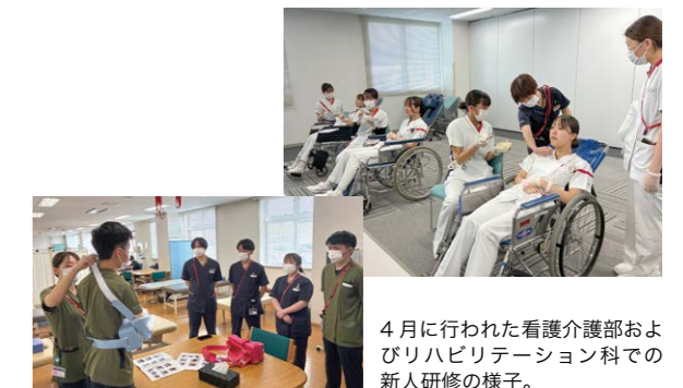
4月に行われた看護介護部およびリハビリテーション科での新人研修の様子。

開西病院では、新入職員の早期育成と専門性向上を目的に、看護介護部とリハビリテーション科で新人研修会を定期的開催。専門職として求められる知識・技術の習得など、段階に応じた内容を実施しています。新入職員が自信を持って業務に臨めるよう、地域医療を支える人材育成に取り組んでまいります。