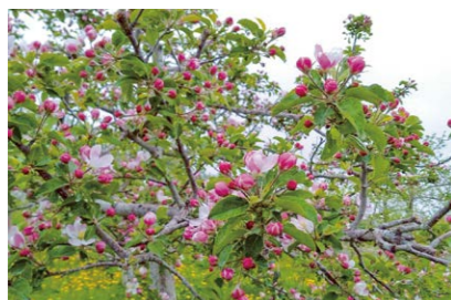
リンゴの花は、品種によってピンクが濃いものや、ほぼ白に近いものも。写真は、千雪の花。

松下リンゴ園 河西郡芽室町北明西6線16番地 TEL.080-1876-8458 ◎(9月下旬～11月下旬) 10:00～14:30 ☎水曜