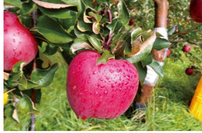
9月下旬から11月下旬にかけて、40種類ものリンゴが収穫期を迎えます。もぎ取り体験も可能。

PROFILE 農機具メーカーで長年営業職として勤務。定年退職後の2008年より、リンゴを中心とした果樹栽培をスタートする。現在は約40品種のリンゴを育て、農園での直売のほか、芽室町内の愛菜屋へ出荷。リンゴジュースやようかんなど、加工品づくりにも取り組んでいる。